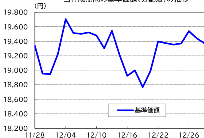
当作成期間の基準価額(分配落)の推移