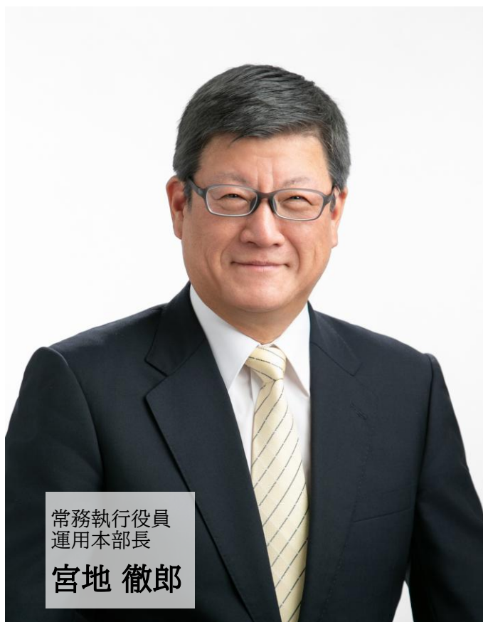
常務執行役員 運用本部長

「株式市場は世の中を映す鏡であり、世の中の大きな変化が大きな株価変化をもたらす」という考え方に基づいた運用を今後も続けていく方針です。投資環境の変化に応じて、投資戦略は機動的に見直してまいります。常に今の投資環境にフィットしたポートフォリオを目指し、リターンの向上に努めてまいりますので、今後とも当ファンドをご愛顧くださいますよう、よろしくお願い申し上げます。